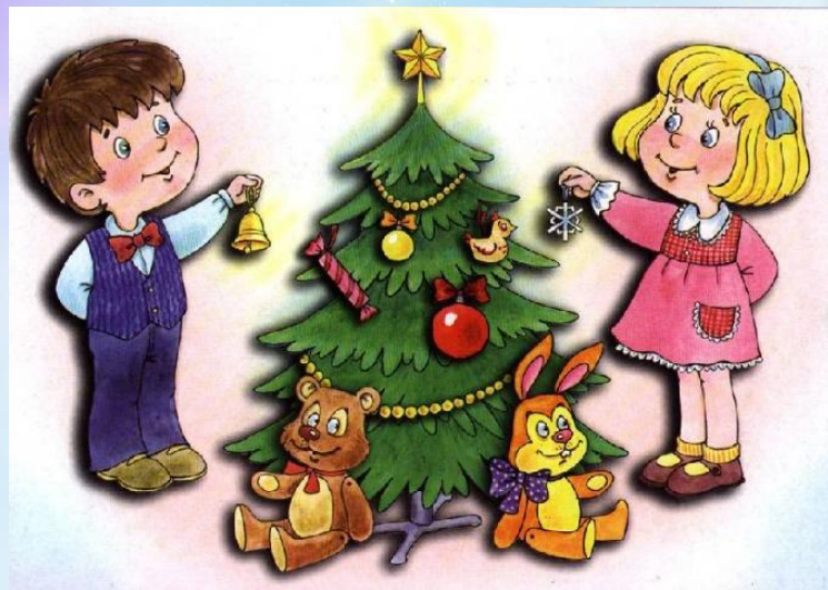
«Самая красивая елка»

Для этого конкурса необходимо подготовиться заранее – натянуть прочную нить на такой высоте, чтобы даже самый маленький мог без труда натянуться. На нить привяжите ниточки, на концах которых прикрепите звездочки, снежинки или небольшие снежки, сделанные из ваты. По команде, ребята должны срезать или аккуратно оборвать их, кто соберет больше, тот выигрывает. Потом вместе с детьми упакуйте в красивую коробочку и отправьте Деду Морозу.