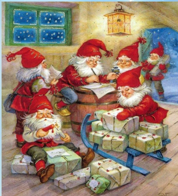
«Самая красивая елка»

Разнообразные игры и конкурсы с детьми – необходимое условие праздничного вечера, а потому заранее продумайте, каким образом лучше задействовать всех присутствующих деток.